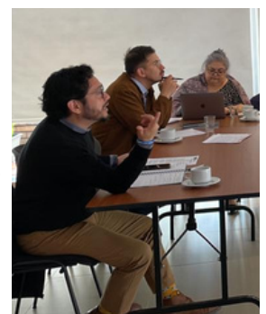
El intercambio ocurrió en Bogotá, Colombia.

El Foro Social de la Deuda Externa y Desarrollo de Honduras (FOSDEH) participó en un intercambio de mecanismos de autoprotección para personas defensoras de derechos humanos.