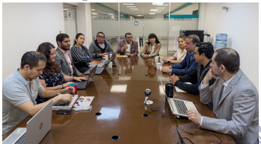
Autoridades del CNA se reunieron en la ciudad de México con representantes de prensa, de medios y casas editoras.

Además del evento público, las autoridades del CNA se reunieron con líderes sociales y de entidades de prensa, de medios de comunicación y editoriales mexicanas para crear alianzas en esta lucha que trasciende fronteras.