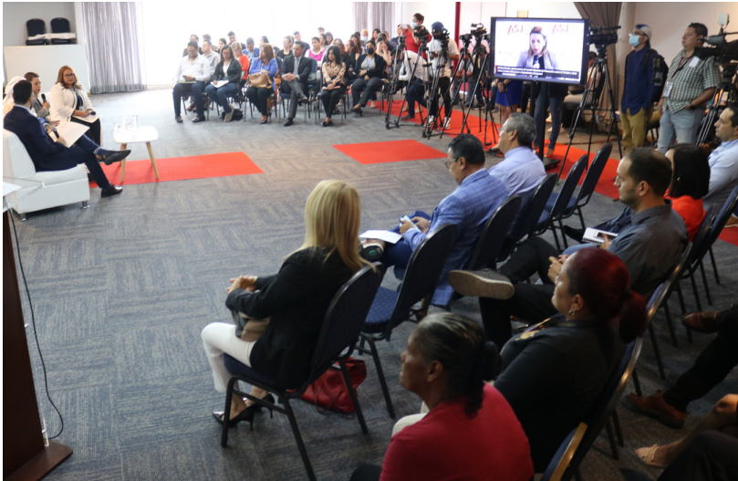
Personas expertas conversaron sobre la crisis en el sistema carcelario hondureño luego de la muerte violenta de 46 privadas de libertad en junio pasado.