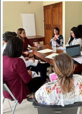
Ambas organizaciones presentaron sus informes.

Cristosal se reunió con la oficina de Cooperación Externa del Comisionado Nacional de los Derechos Humanos para unir esfuerzos en la defensa de derechos en el marco del estado de excepción que restringe garantías constitucionales.