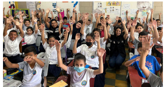
El CNA realiza las capacitaciones sobre moral y ética en los centros educativos de varios departamentos.

Como parte del programa Veeduría Estratégica Regional el CNA realiza capacitaciones a menores en escuelas, institutos y universidades de varios departamentos. El objetivo es hacer que la juventud reflexione sobre los valores éticos y morales ante la sociedad.