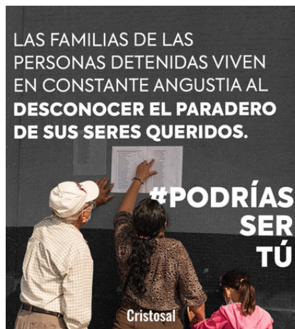
Más de 3,000 familias desconocen el paradero de un ser querido.

Además de reformas al sistema y un hacinamiento del 157% de personas detenidas, los expertos y expertas que conversaron ante líderes sociales explicaron que el Estado no otorga los recursos necesarios para un sostenimiento básico de prisiones.