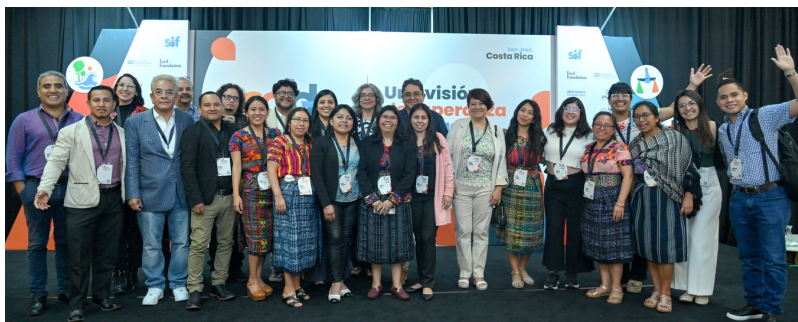
Las personas profesionales guatemaltecas exiliadas se reunieron en Costa Rica.