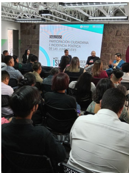
El encuentro de jóvenes anticorrupción fue el 20 y 21 de octubre.

El CNA busca impactar de forma positiva en la juventud hondureña y mostrarle que la transparencia y el buen liderazgo se ejercen e impactan en todos los ámbitos de la vida.