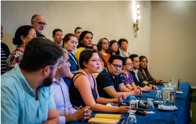
Representantes de decenas de organizaciones, incluidas Acción Ciudadana y el ICEFI , apoyan una transición democrática de los poderes Ejecutivo y Legislativo.