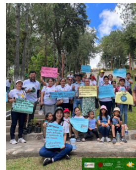
Las personas participan por un mejor ambiente.

La Asociación de Organismos no Gubernamentales ( Asonog ) participó en una marcha en defensa del medio ambiente, organizada por diversas entidades para fortalecer los entornos sanos.