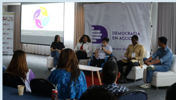
El encuentro contó con charlas, foros y debates sobre inclusión, transparencia y derechos humanos

El encuentro de cuatro días contó con charlas, foros y debates. Las y los jóvenes crearon y presentaron ante diputados del Congreso dos propuestas de iniciativas de ley: una en favor de las personas con capacidades diferentes y otra por la transparencia.