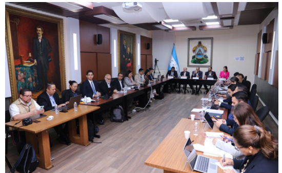
FOSDEH participa con otras organizaciones en las mesas de diálogo.

FOSDEH participa en las mesas de diálogo sobre el Presupuesto 2024 que suma 248 mil millones de lempiras (unos US$10 mil millones), y busca que el Congreso Nacional analice las fuentes de financiamiento y que se destinen más recursos a programas sociales.