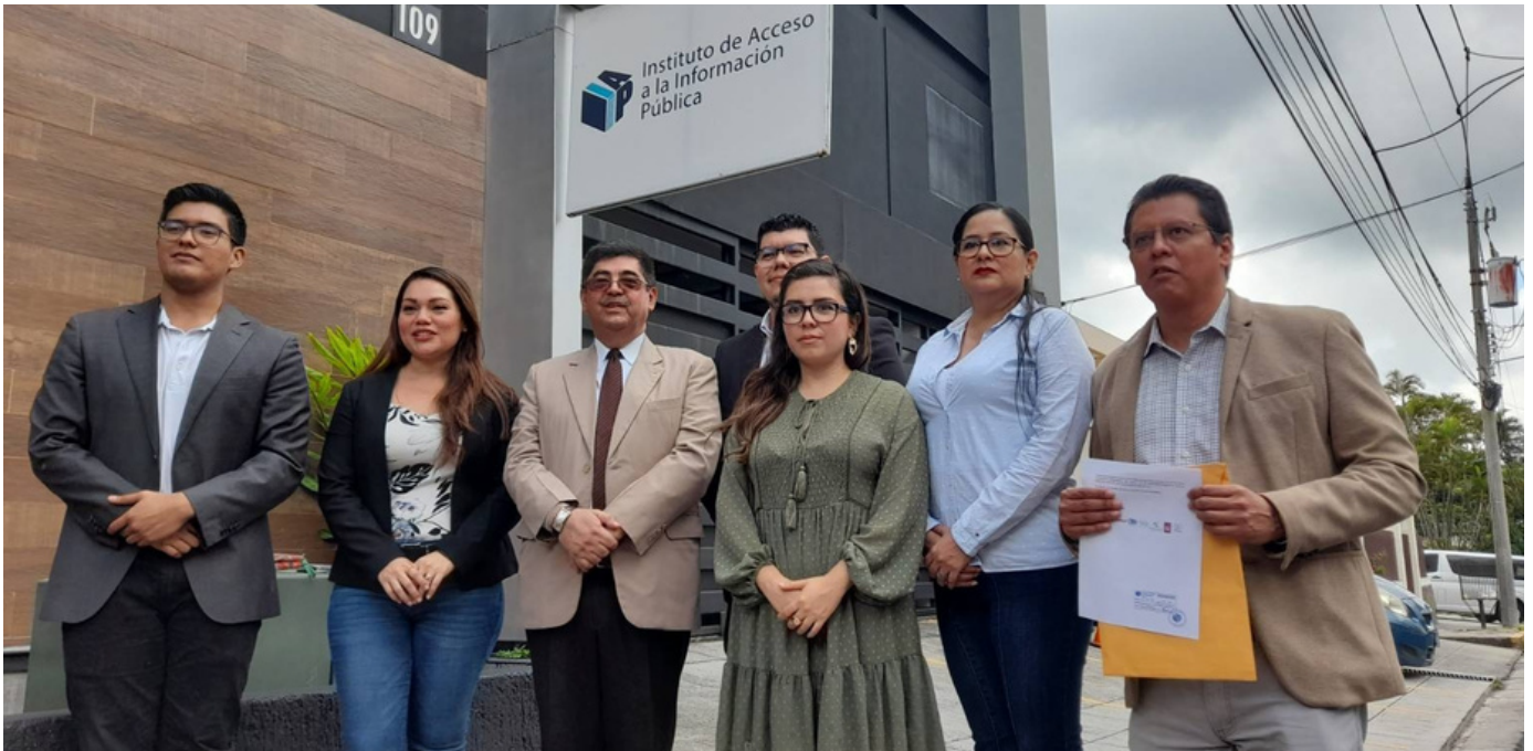
Representantes del CCINOC en las afueras del Instituto de Acceso a la Información, tras presentar la petición.