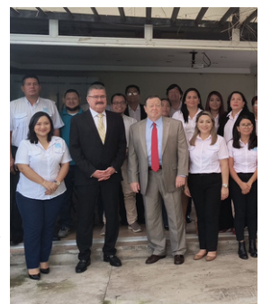
El embajador William Duncan visitó la sede de la FUNDE .

El embajador de Estados Unidos visitó la Fundación Nacional para el Desarrollo ( FUNDE ) para conocer el trabajo que realizan en favor de la transparencia en el sector público y en diversas comunidades.