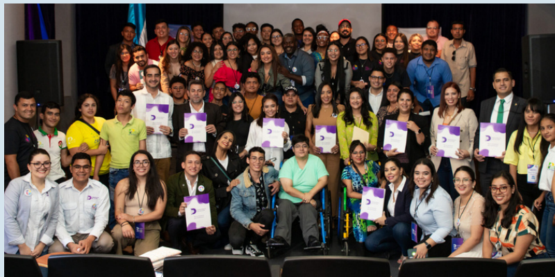
Las y los jóvenes interactuaron y se capacitaron durante cuatro días.