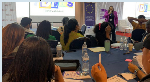
El evento regional incluyó talleres y experiencias de trabajo conjunto en favor de la democracia.