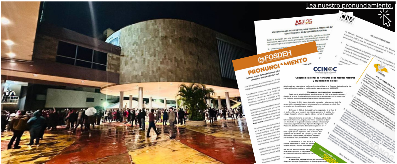
Lea nuestro pronunciamiento.

Un estudio de ASJ identificó que en el tercer trimestre de 2023 las y los diputados llegaron al Congreso únicamente 47 horas; es decir, no más de 1 hora por día. El pago por hora para una persona legisladora en Honduras es de 6,761 lempiras (unos US$275 ), mientras el salario mínimo es de 72 lempiras ( US$2.90 ) por hora.