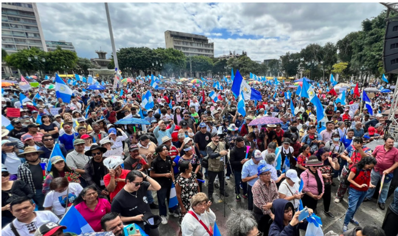
El paro nacional indefinido en Guatemala incluyó cierres en carreteras y múltiples movilizaciones ciudadanas.

Acción Ciudadana también ha accionado legalmente en contra de actores que buscan dañar la democracia tanto ante el Organismo Judicial como ante la Corte de Constitucionalidad, y Cristosal elaboró un sistema de monitoreo y apoyo a personas defensoras sociales que hayan sido o estén siendo vulneradas por defender la democracia y la libertad de expresión.