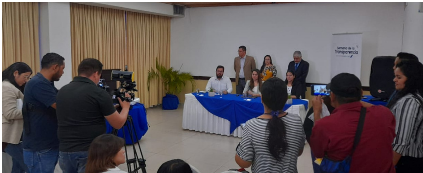
En las actividades participaron personas expertas de Acción Ciudadana , Cristosal , Funde y TRACODA organizaciones del CCINOC .