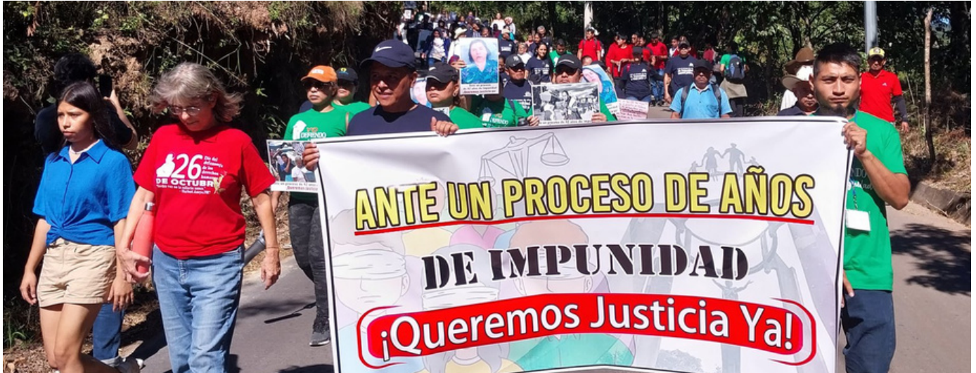
Familiares de las víctimas y personas expertas en derechos humanos recordaron a las víctimas de la masacre de 1981.