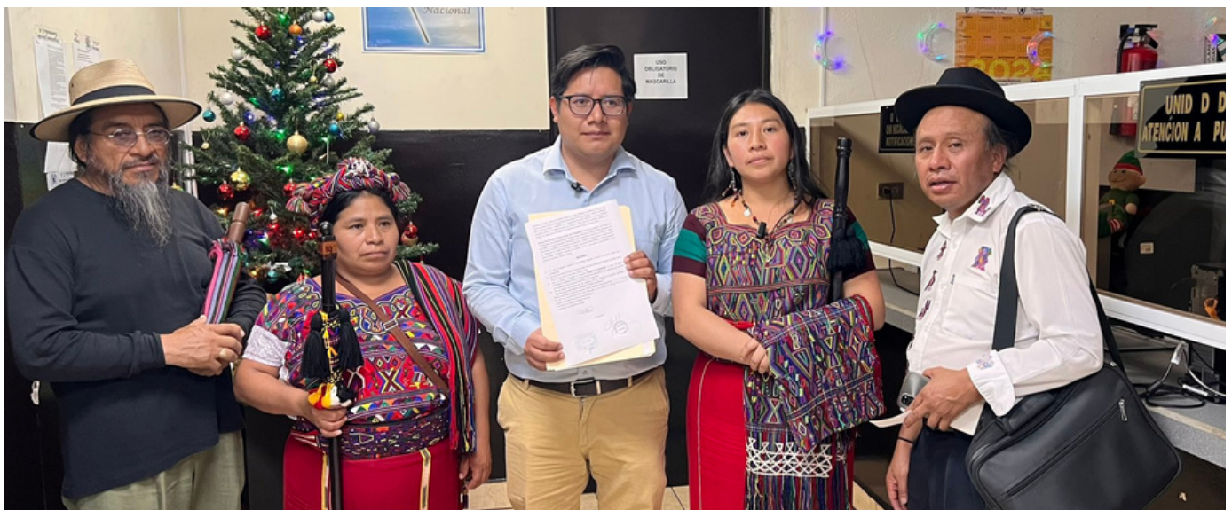
Acción Ciudadana y autoridades indígenas ancestrales presentaron dos acciones judiciales para que la fiscal general sea localizada, pero los jueces no han cumplido con las acciones planteadas.