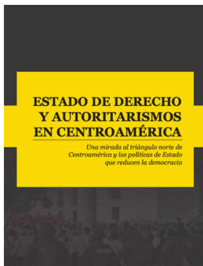
El análisis de la región fueron presentado el 9 de diciembre. Puede leerse aquí.

El análisis sobre las acciones de los gobernantes en Honduras, Guatemala y El Salvador alerta sobre las políticas de Estado que socavan la democracia y los peligros de la ausencia de división de poderes.