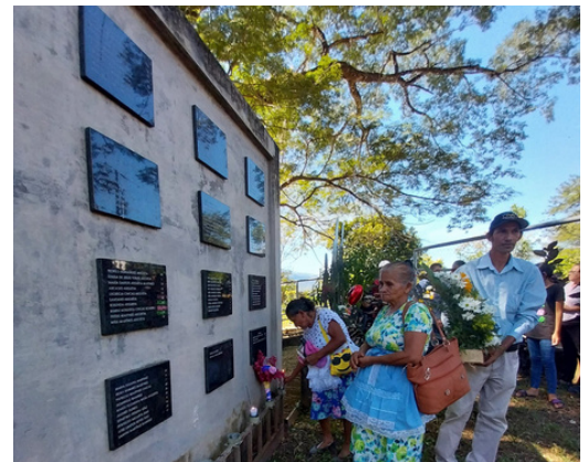
La masacre cobró la vida de más de 900 personas.

Entre el 9 y el 12 de diciembre de 1981, el Estado masacró a más de 900 personas incluidas 500 menores de edad.