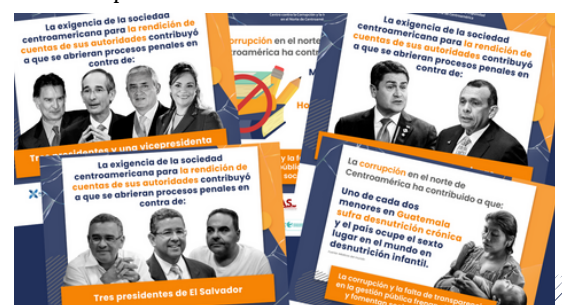
La campaña fue promovida por el CCINOC .

En conmemoración del Día Internacional contra la Corrupción el 9 de diciembre, las 11 organizaciones del CCINOC lanzaron la primera semana del mes una campaña en redes sociales para mostrar los efectos de la corrupción en el norte de Centroamérica.