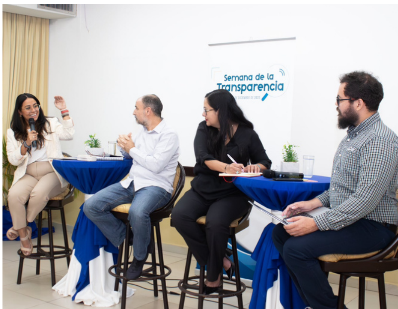
Representantes de diversas organizaciones sociales participaron de la Semana de la Transparencia en San Salvador.

También se presentaron los resultados de informes coordinados por las organizaciones que integran el CCINOC y que forman parte del trabajo de veeduría social en el país.