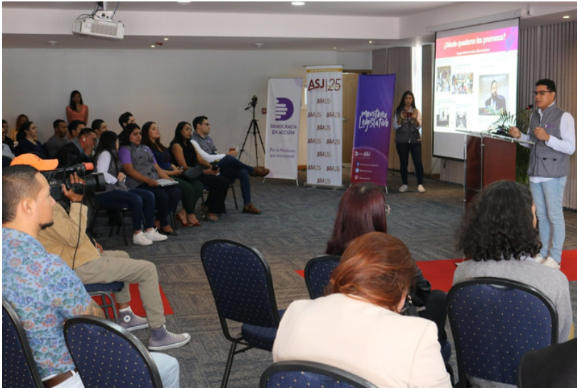
Otra muestra del nulo avance en la lucha anticorrupción es que se reprobó la calificación para acceder a fondos del Gobierno de EE.UU.