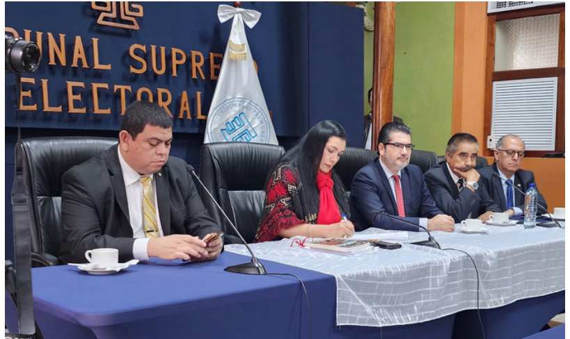
La criminalización y persecución del Ministerio Público de Guatemala se centró en diciembre en contra del Tribunal Supremo Electoral.

Acción Ciudadana presentó dos acciones judiciales para que jueces localizaran a Porras y Cristosal e Icefi también mantienen la lucha por la defensa de la democracia y la transición del Gobierno electo.