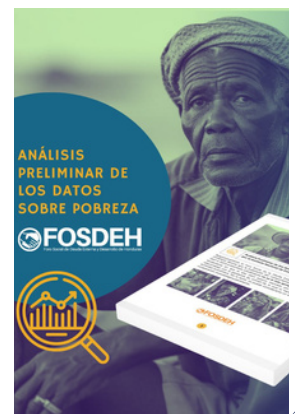
El análisis sobre la pobreza puede leerse aquí .

Según el análisis del FOSDEH a las cifras de reducción de pobreza presentadas por el Gobierno, estas no muestran la realidad porque usaron datos de 2020-2022, período con un empuje económico atípico debido a la pandemia.