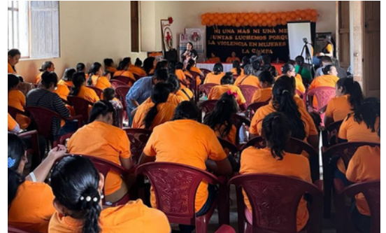
Grupos de mujeres participaron de la jornada de aprendizaje en varios municipios.

Asonog lideró una campaña para el empoderamiento de las mujeres y en contra de la violencia de género en varios municipios. Se realizaron foros, presentación de documentales, discusiones y capacitaciones.