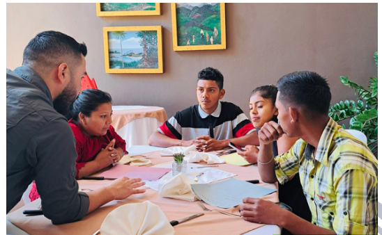
Asonog coordinó las capacitaciones para la población joven.

Asonog coordinó con Oxfam Centroamérica el taller Comunicando para el cambio con el cual buscan empoderar a la juventud y promover los espacios democráticos y la justicia desde las comunidades.