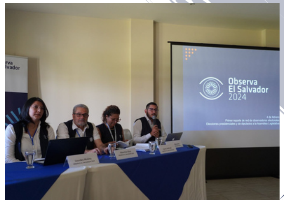
La misión Observa El Salvador , de la cual forma parte Icefi , monitoreó el proceso.