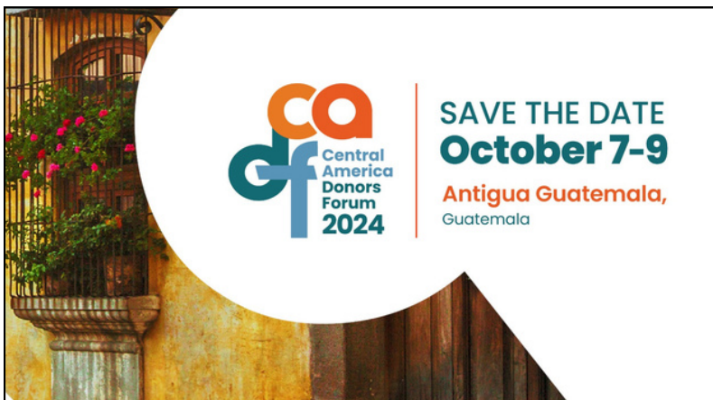
Es la segunda vez que el Foro Centroamericano de Donantes reunirá en Antigua Guatemala a personas que trabajan por la democracia. Conoce aquí los detalles.

La Fundación Internacional de Seattle (SIF) anunció que el Foro Centroamericano de Donantes (CADF) 2024 se realizará en la ciudad de Antigua Guatemala, Guatemala, del 7 al 9 de octubre, en el contexto de un país que inspira solidaridad y avances democráticos. El evento diseñará una ruta para que cientos de personas líderes y expertas profundicen en los problemas más apremiantes que enfrenta Centroamérica.