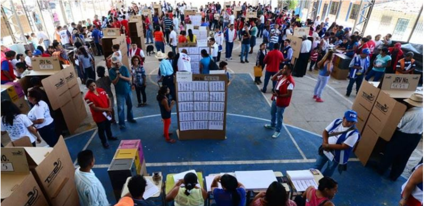
La elección presidencial y legislativa se realizó el 4 de febrero y la municipal y al Parlamen el 3 de marzo.

Información mensual sobre las acciones en el norte de Centroamérica