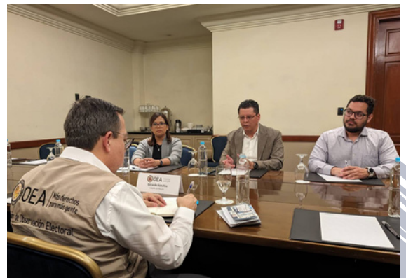
Representantes de Acción Ciudadana y TRACODA se reunieron con observadores de la OEA.

En ambas votaciones hubo denuncias de conteos irregulares en muchos centros de votación, lo que llevó a una crisis a lo interno del Tribunal Electoral.