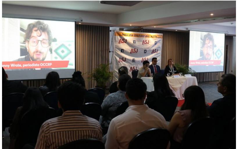
Las organizaciones del CCINOC realizaron una investigación social a partir de las revelaciones periodísticas del uso de préstamos del banco regional.

Algunas de las obras denunciadas son la construcción de una represa en Honduras, los fondos utilizados para comprar bitcoins en El Salvador y la carretera pagada a Odebrecht en Guatemala.