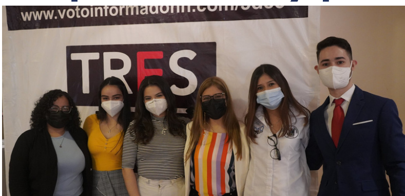
Representantes de Democracia en Acción y ASJ durante la presentación de la propuesta de ley para transparentar la gestión pública.