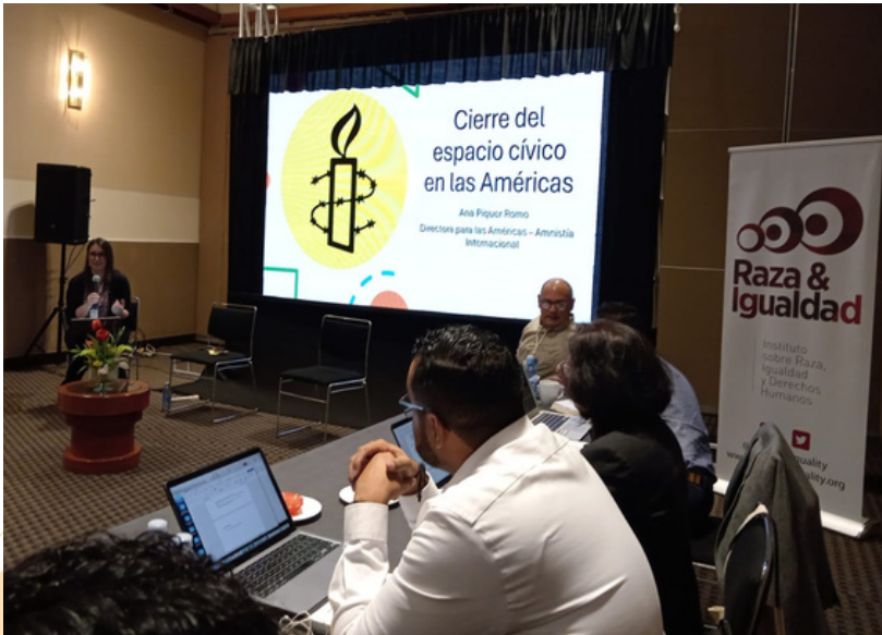
Cristosal participó en el encuentro de organizaciones sociales de las Américas que luchan por la democracia y el Estado de derecho.