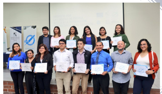
El grupo de periodistas que recibió el diplomado.

Cristosal , Funde y la Asociación de Periodistas de El Salvador realizaron un diplomado para capacitar a periodistas en derechos humanos y transparencia.